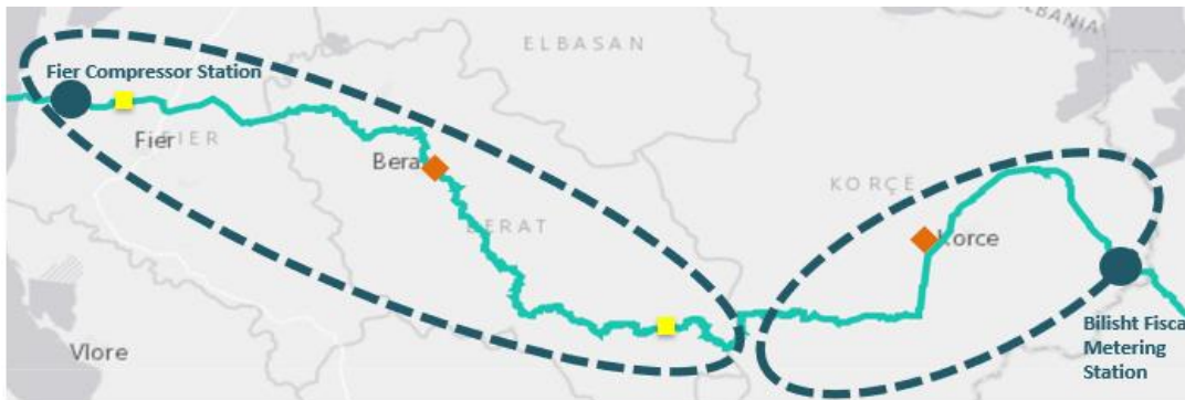
Figura 2: Ndarja e tubacionit në dy zona kryesore

Tubacioni që kalon territorin është rreth 215 km, i cili fillon nga kufijtë jug-lindorë me Greqinë dhe përfundon në bregdetin e detit Adriatik. Tubacioni përbëhet nga dy zona kryesore, zona e Korçës dhe zona e Beratit, Çorovodës dhe Fierit.